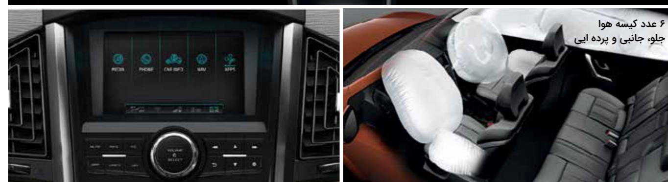
۶ عدد کیسه هوا جلو، جانبی و پرده ای