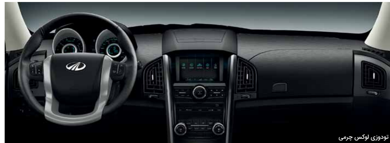
تودوزی لوکس چرمی