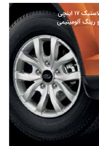
لاستیک ۱۷ اینچی و رینگ آلومینیومی